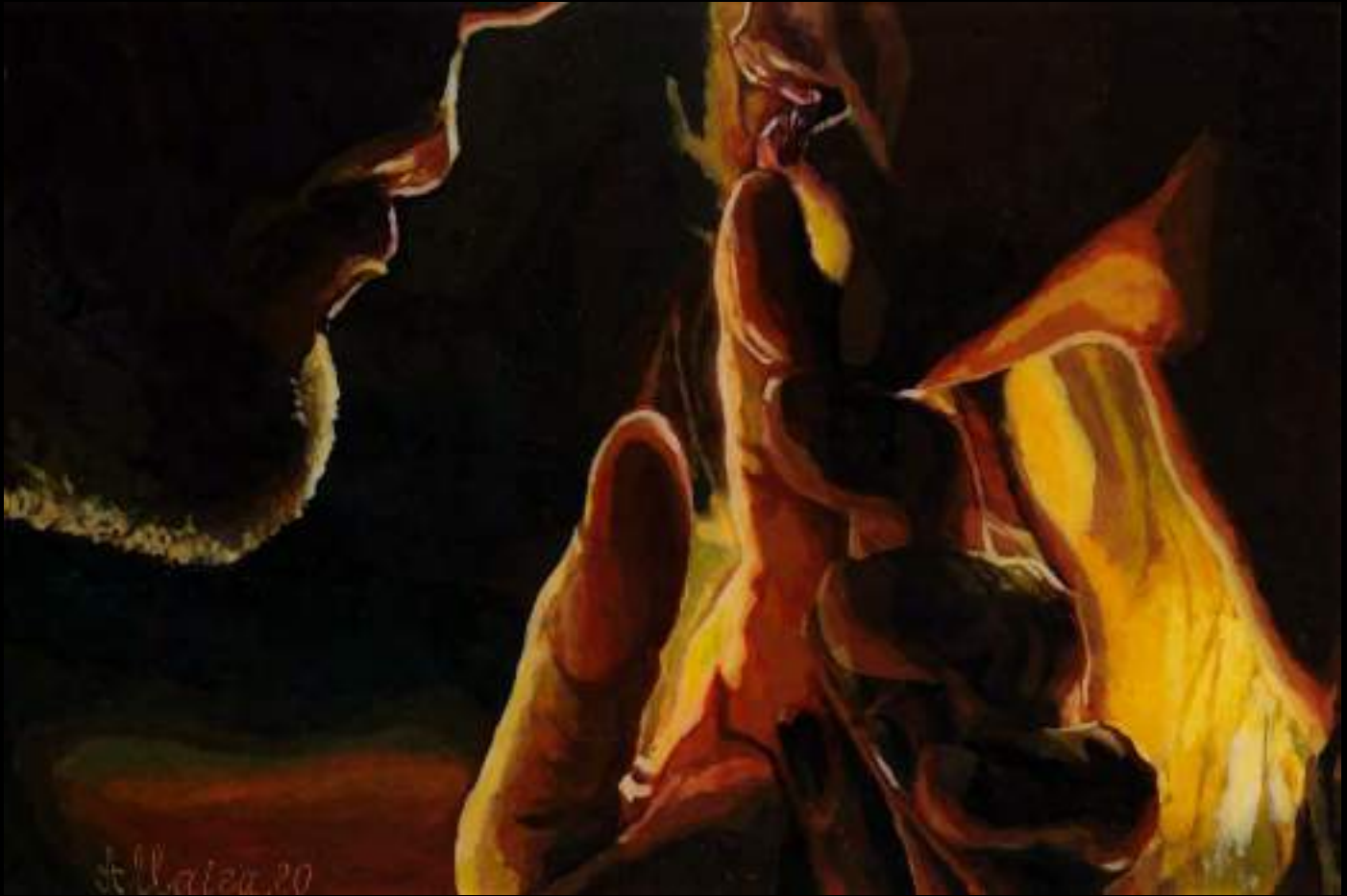
« Désir », 20x30cm, plasticine/verre acrylique, 2020