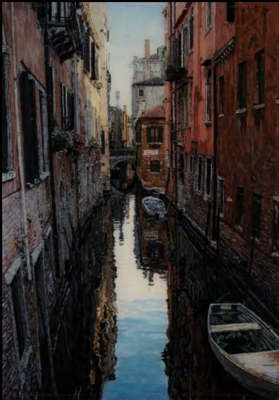
« Venise », 50x35cm, plasticine/verre acrylique, 2008