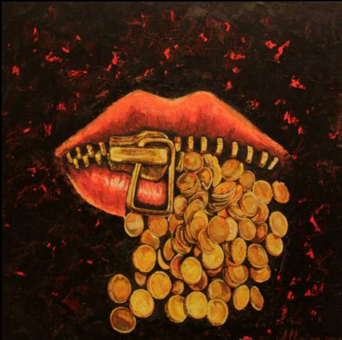
« Silence est d'or », 40x40cm, acrylique/toile, 2020