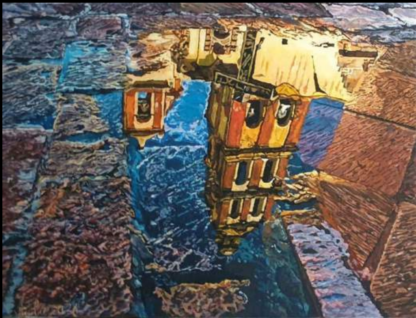
« Santo Domingo », 30x40cm, plasticine/verre acrylique, 2021