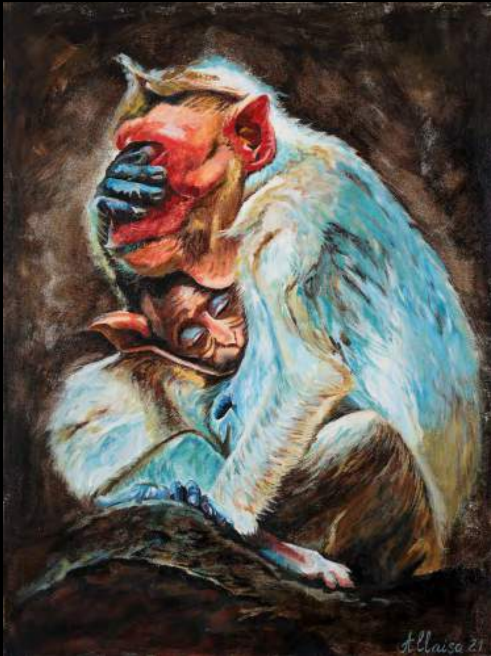
« Ode à la maternité », 80x60, acrylique/toile, 2021