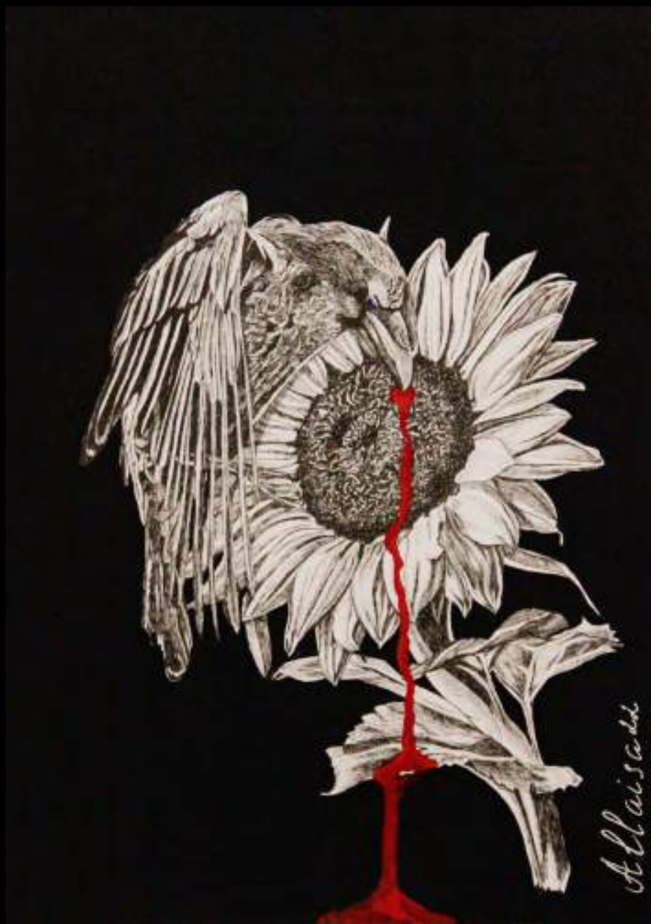
« Barbares », 30x20cm, technique mixte/carton, 2022