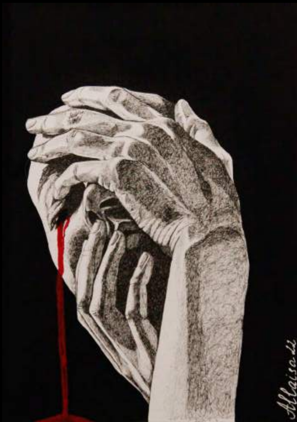
« Impuissance », 30x20cm, technique mixte/carton, 2022