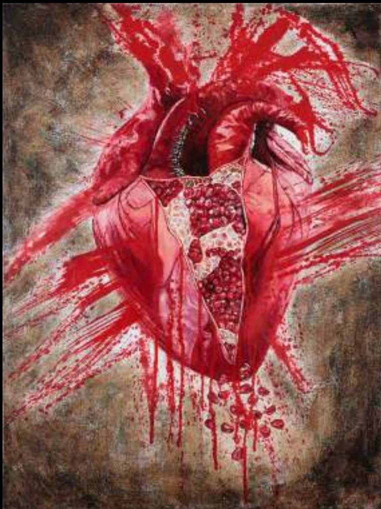
« Grains d'amour » 80x60cm, acrylique/toile, 2021