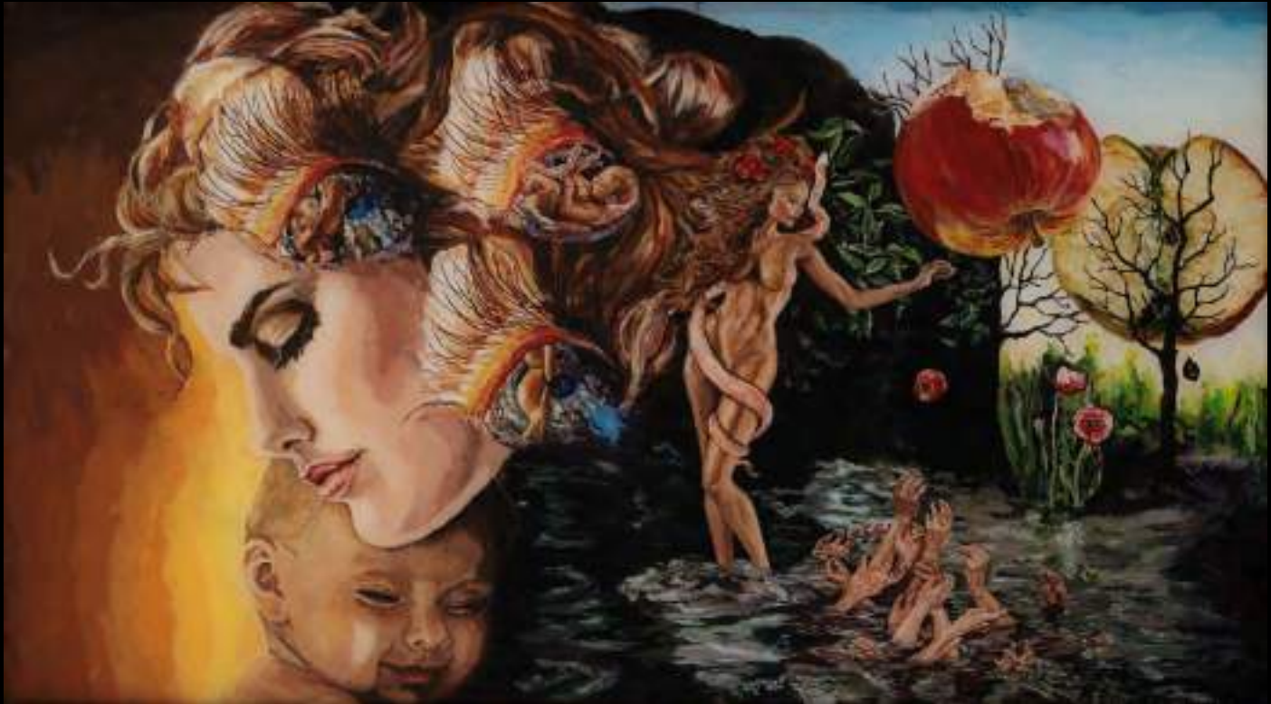
« Traces de femme » (recto), 29x50cm, plasticine/verre acrylique, 2013

Une femme peut laisser derrière elle une trace choisie par elle-même, elle peut semer la graine du vice. L'ancêtre Eve jette une pomme de tentation dans des nombreuses mains de ceux qui ont soif de ce qui est facilement accessible, pécheur, dépravé, il est une pomme mûre, juteuse, attirante, mais avec un ver lorsqu'elle est mordue, l'autre moitié de la pomme sème une graine à partir de laquelle pousse un arbre mort, sans feuillage, ne laissant aucune ombre, aucun reflet... et un symbole de coquelicot du désir.