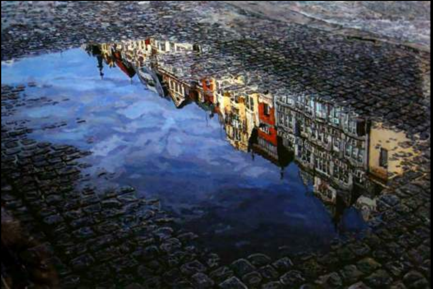
« Reflet », 12x18cm, plasticine/verre acrylique, 2017