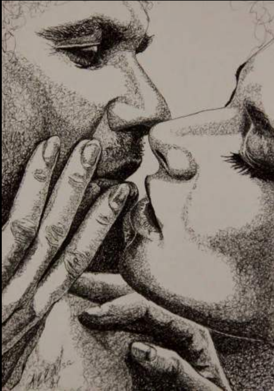
« Peu avant », 21x15cm, encre de Chine/carton, 2021