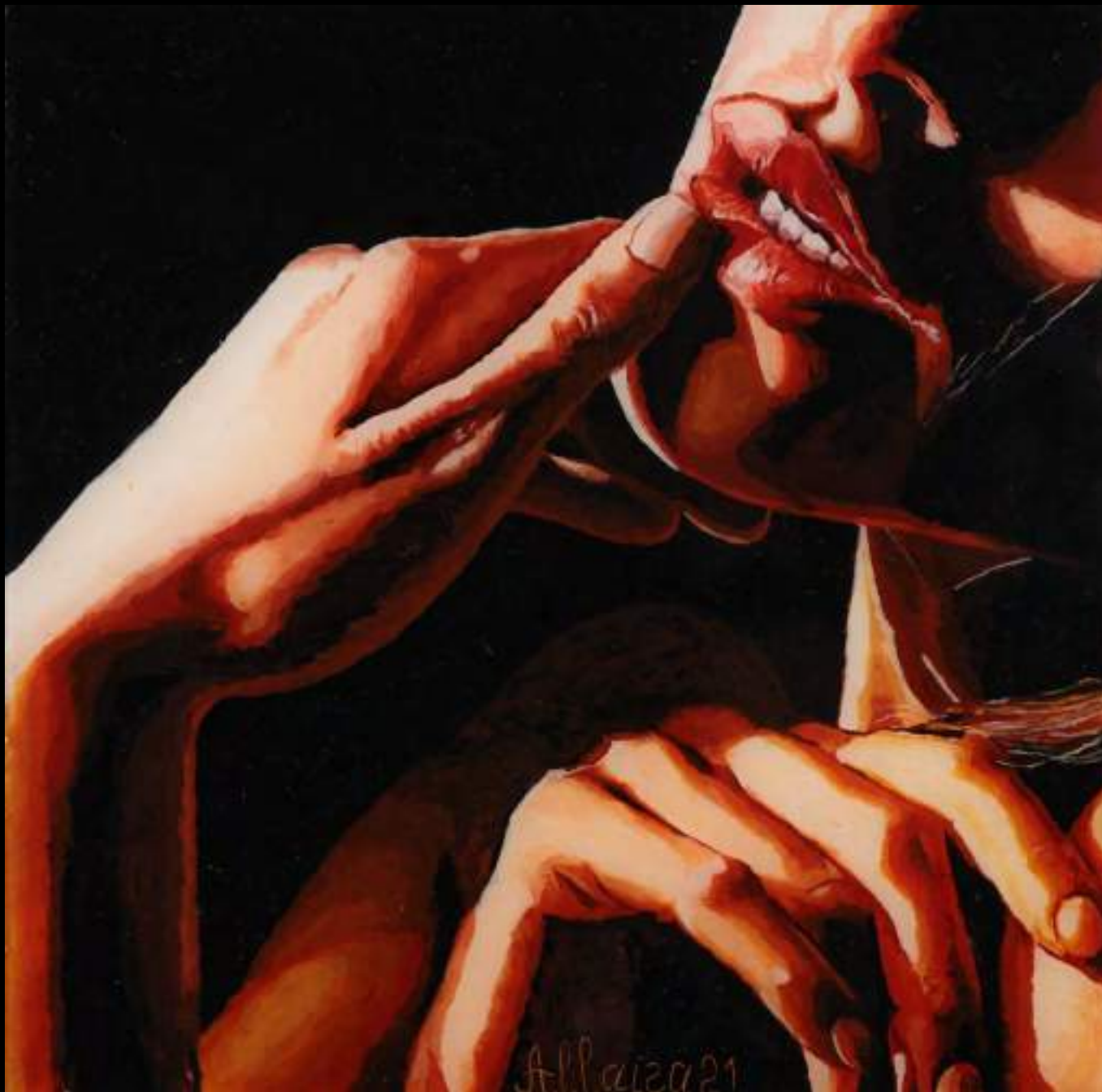
« Au bord de fantaisies », 30x30cm, plasticine/verre acrylique, 2021