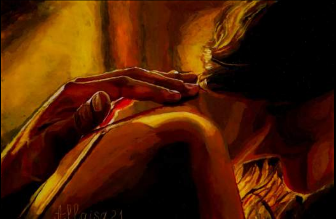
« Amour parfait », 20x30cm, plasticine/verre acrylique, 2021