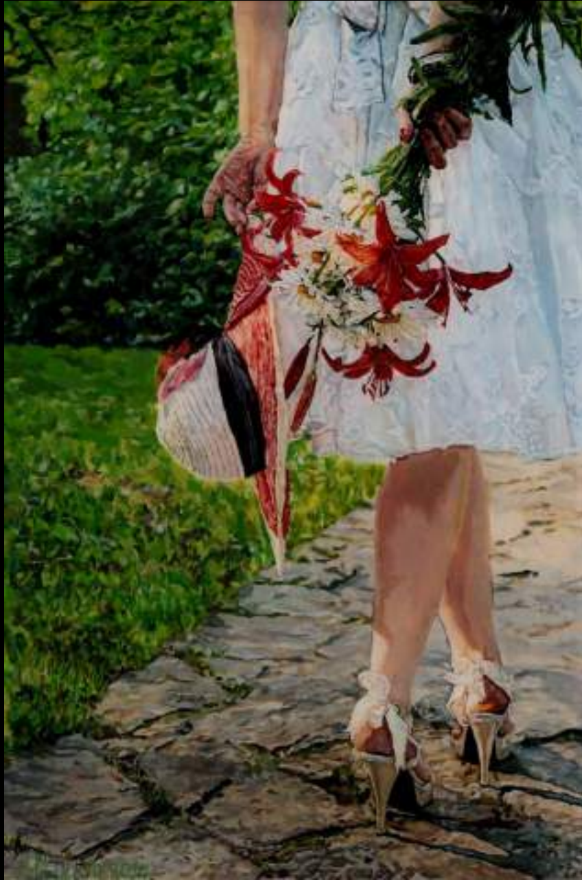
« Tendresse », 30x20cm, plasticine/verre acrylique, 2014