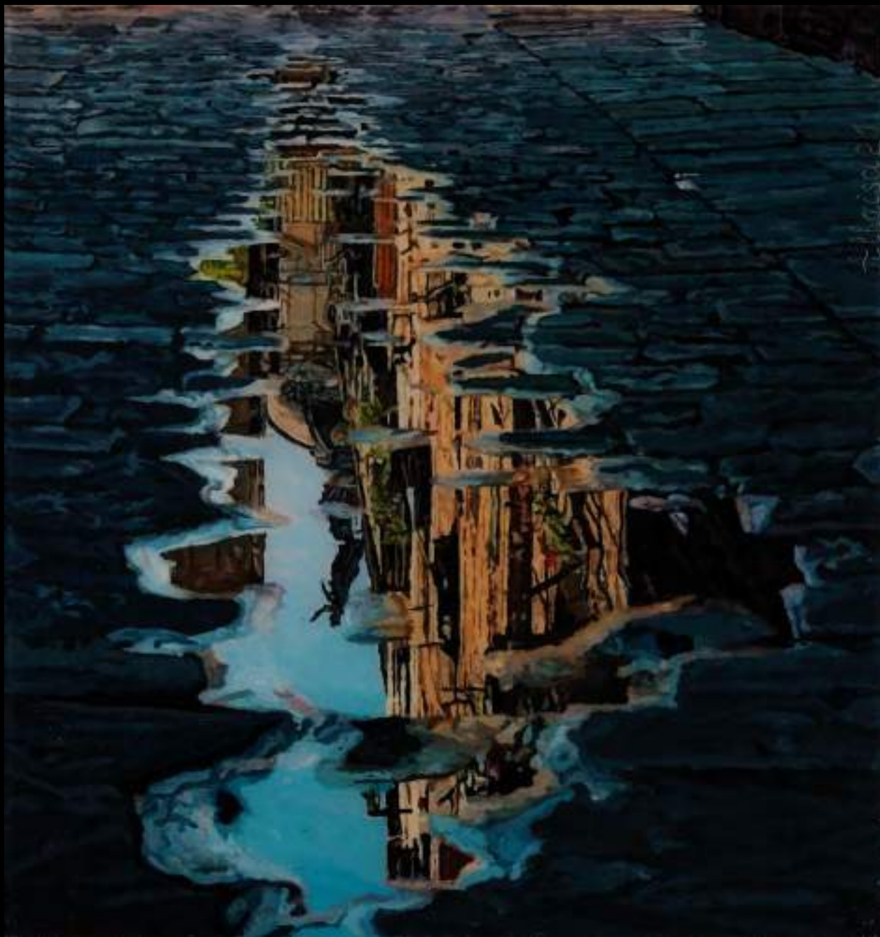
« Petit monde », 30x28cm, plasticine/verre acrylique, 2021