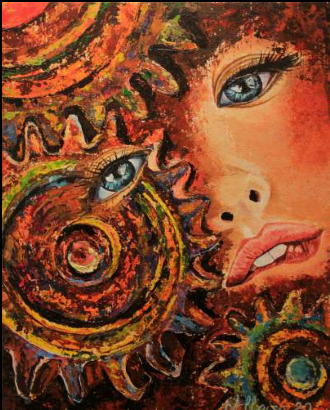
« Meules du temps », 50x40cm, acrylique/toile, 2010