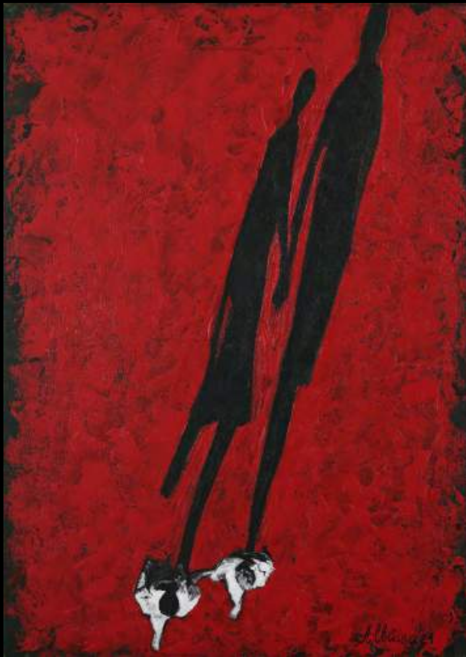
« Deux » 70x50cm, acrylique/toile, 2021