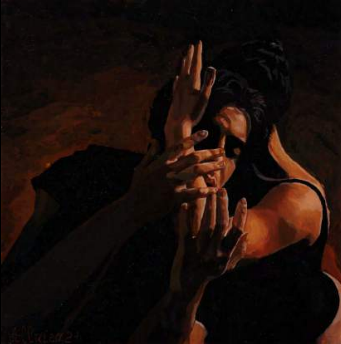
« Dance des sentiments », 30x30cm, plasticine/verre acrylique, 2021