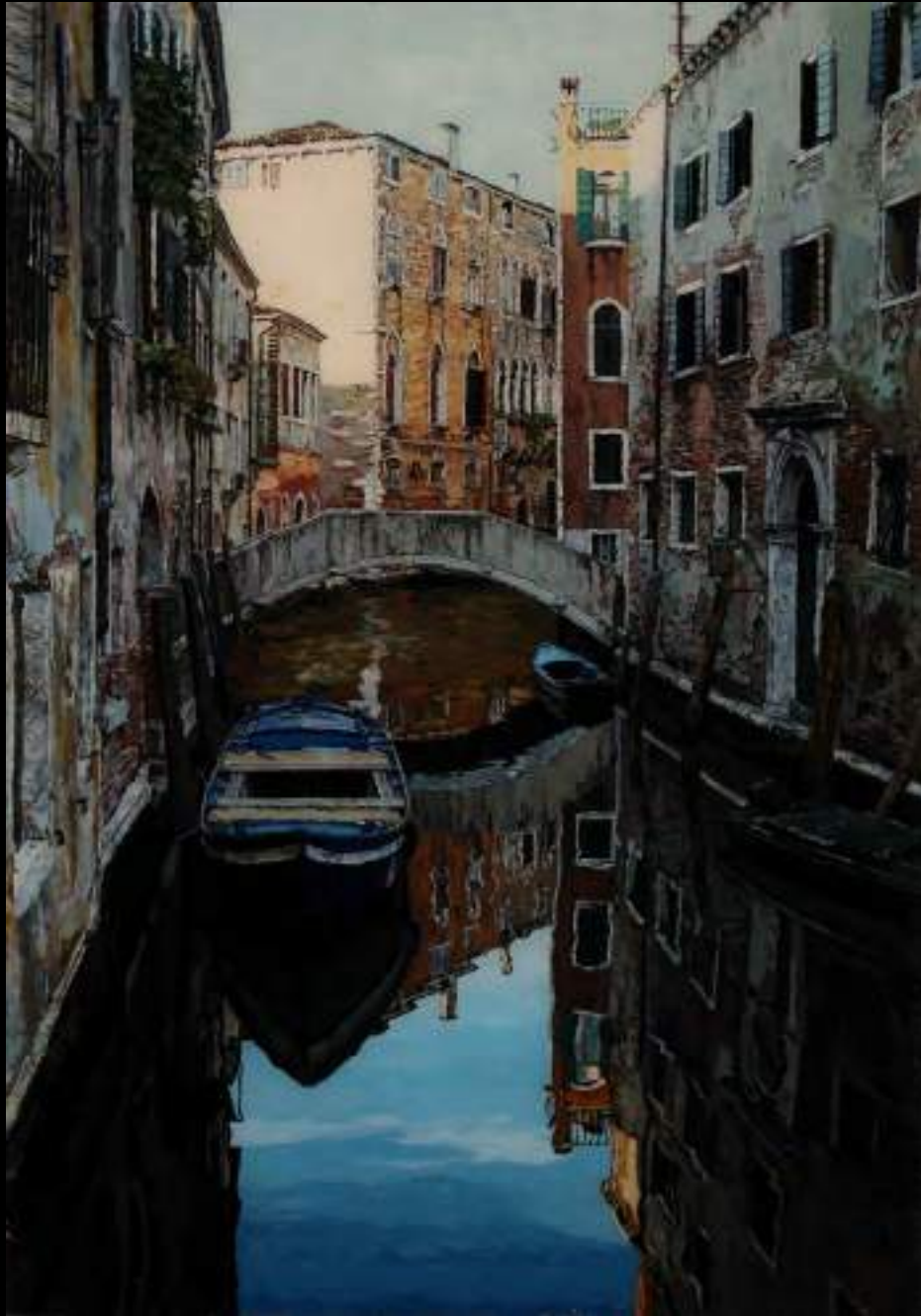
« Canal vénitien », 50x35cm, plasticine/verre acrylique, 2012