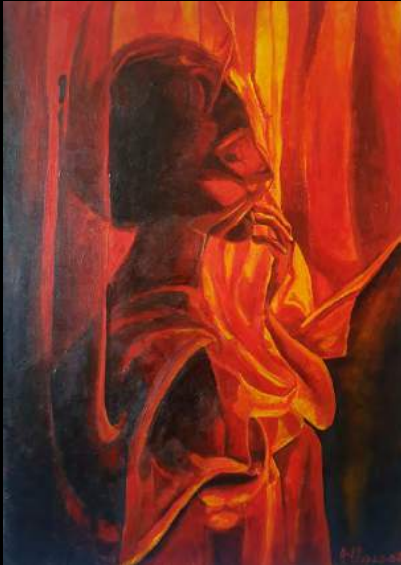
« Enigme » 92x65cm, acrylique/toile, 2021