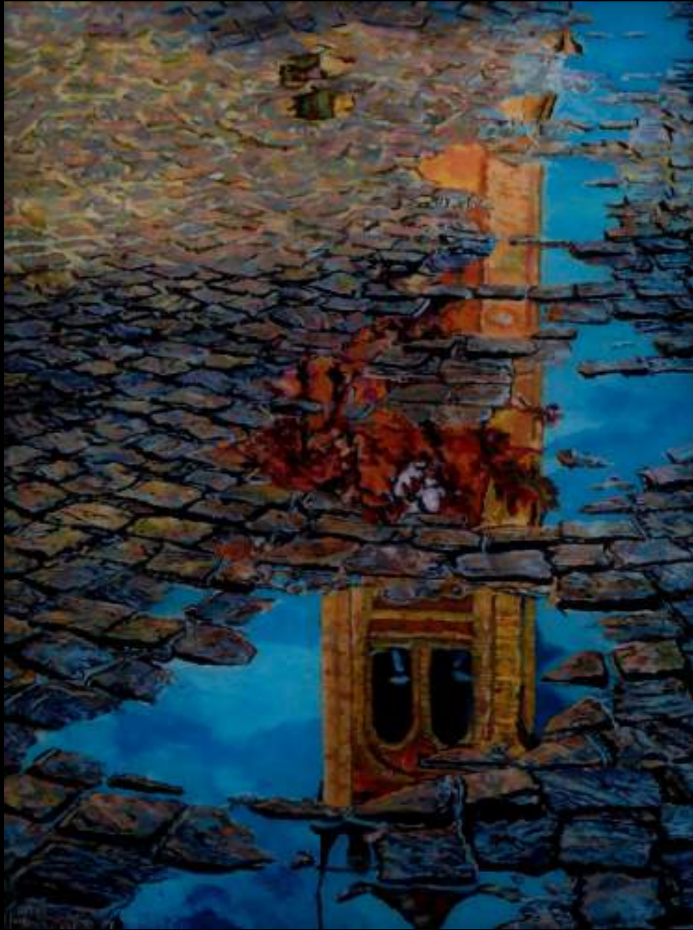
« Ciel sur les pavés », 26x19cm, plasticine/verre acrylique, 2020