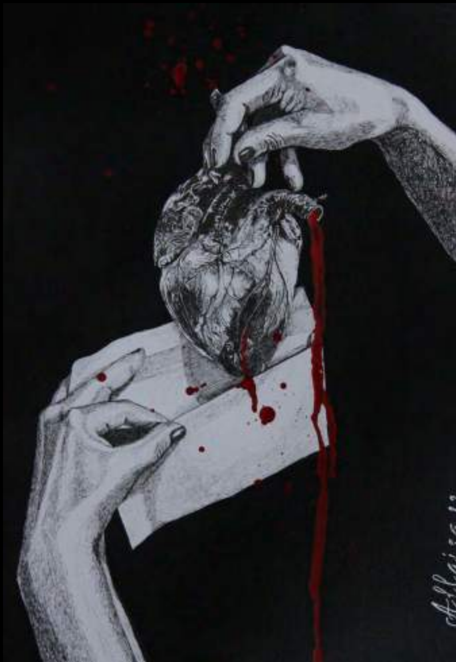
« Poste restante », 30x20cm, techniques mixtes/carton, 2022