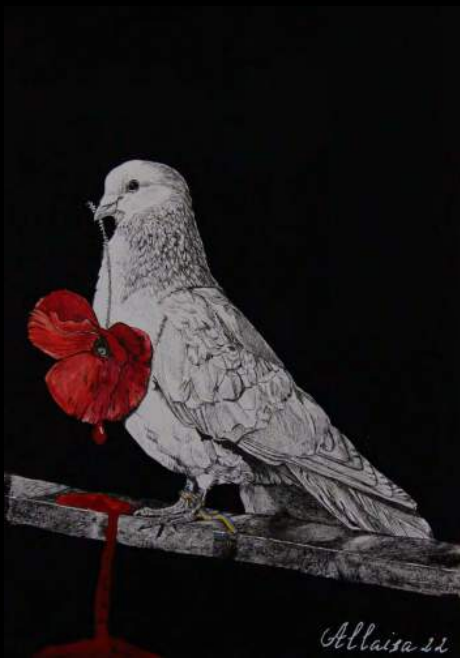
« Printemps rouge », 30x20cm, technique mixte/carton, 2022