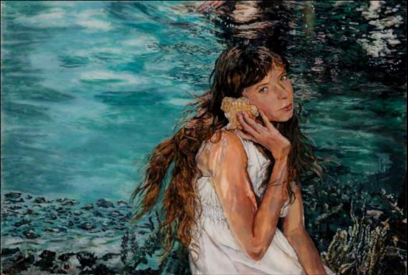
« Sous l'eau », 29x42cm, plasticine/verre acrylique, 2014