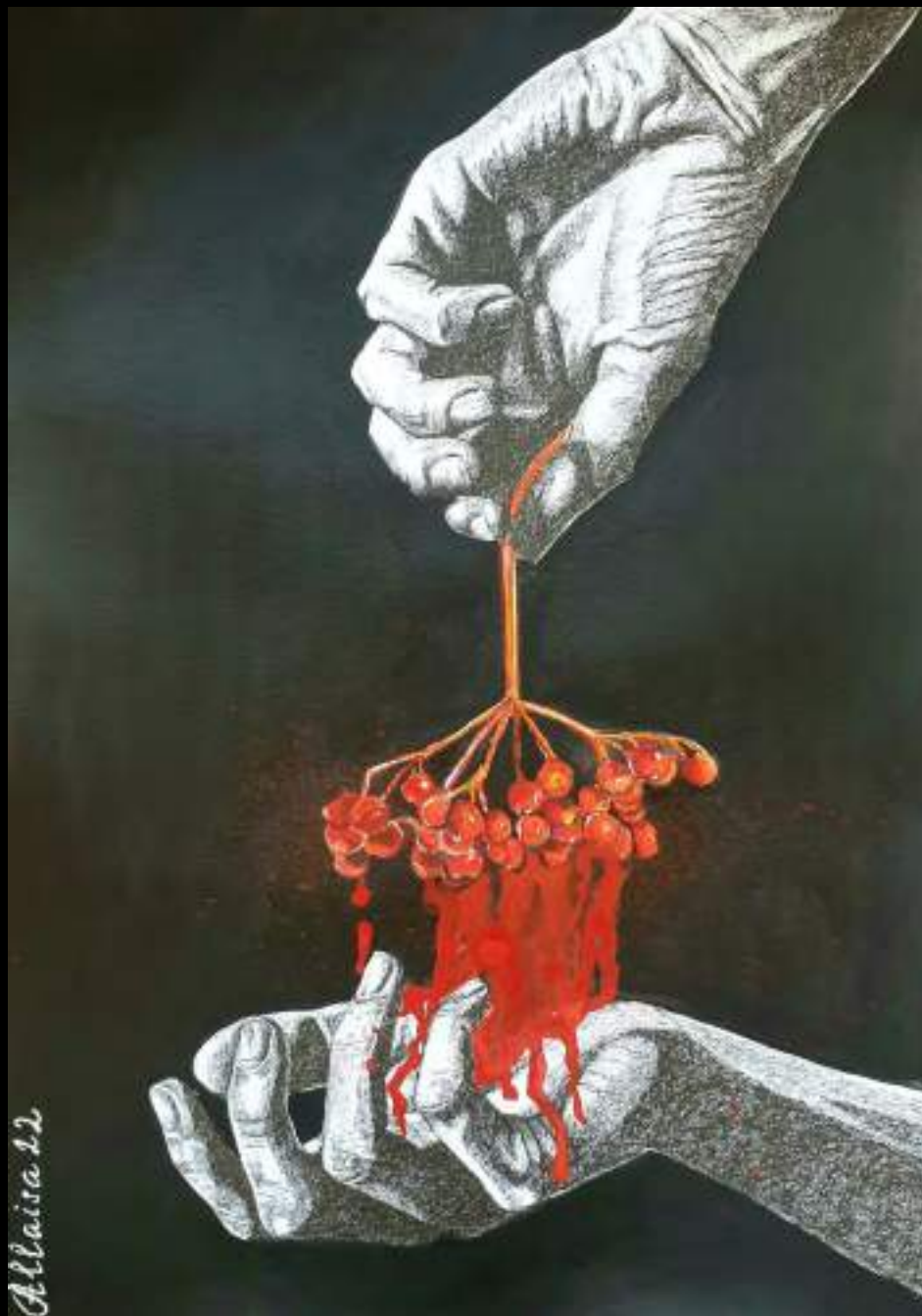
« Viorne », 30x20cm, technique mixte/carton, 2022