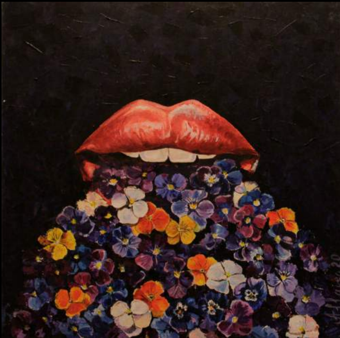
« Discours parfumé », 40x40cm, acrylique/toile, 2020