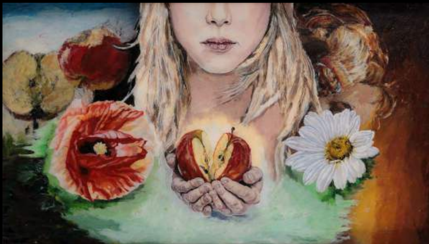
« Traces de femme » (verso), 29x50cm, plasticine/verre acrylique, 2013