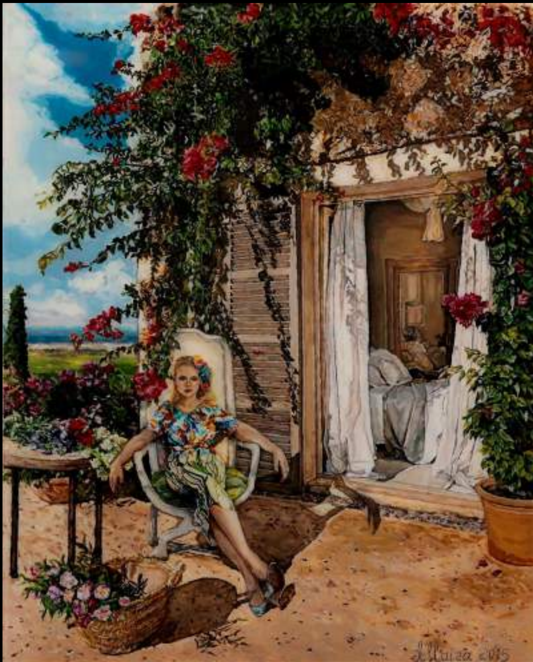
« Rêveuse », 36x29cm, plasticine/verre acrylique, 2015